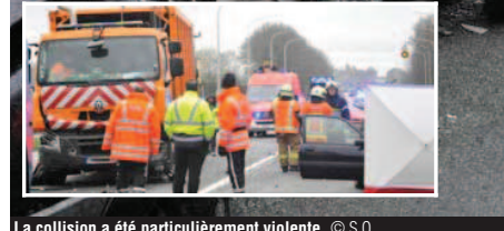
La collision a été particulièrement violente.

pert n'a été dépêché sur les lieux du drame. Les policiers de la WPR (police de la route) et de la zone locale se sont chargés des constatations en attendant que les pompes fu-