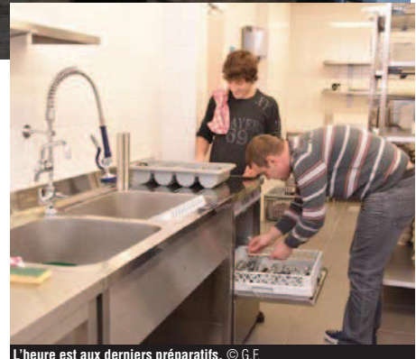
L'heure est aux derniers préparatifs.

Plusieurs formules sont proposées aux clients. Les menus sont consultables sur internet, à l'adresse www.pontauray.be le restaurant se trouve à Walcourt, place des Combattants. Infos et réservations au 0486/60.23.50.